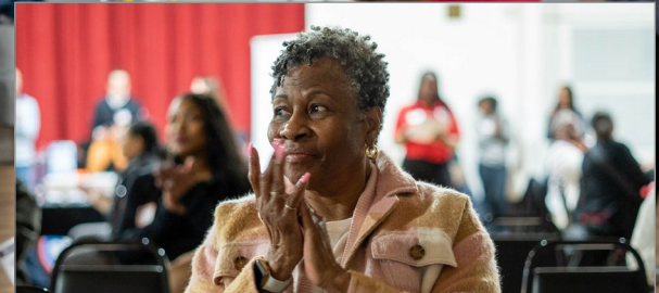
Los residentes asistieron a tres reuniones para conocer cuándo comenzaría el trabajo, dónde se realizaría y cómo afectaría a la comunidad.