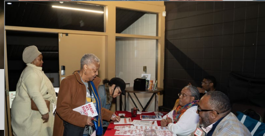
Los residentes locales pudieron hablar con profesionales de la construcción sobre los próximos trabajos.