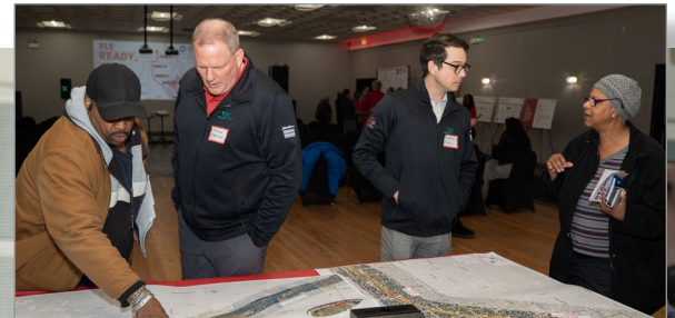
CTA y el contratista de RLE usaron mapas grandes para demostrarle a los residentes cómo avanzaría la construcción en toda la comunidad.