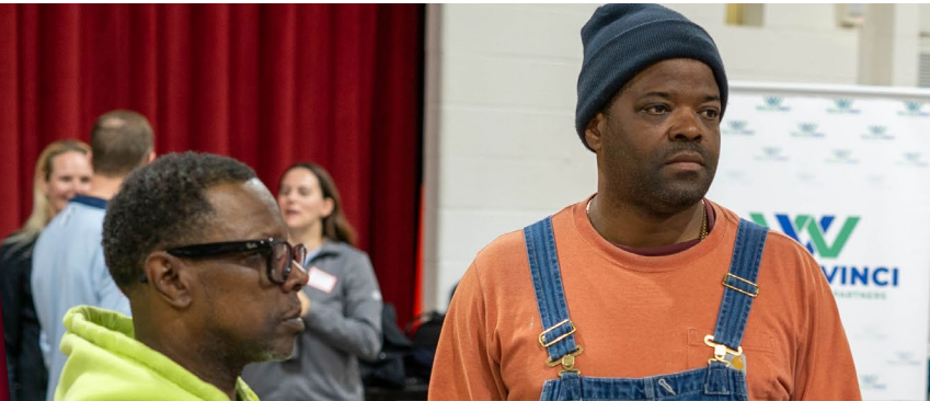
Los participantes de la reunión conversaron con los colaboradores socios de la fuerza laboral después de la presentación.