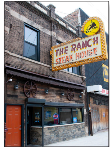
Ware Ranch Steak House