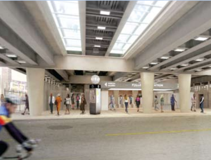
Ilustración de la estación Fullerton de la CTA.