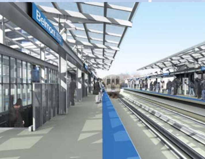
Ilustración de la estación Belmont de la CTA.

Los trenes anden por una vía menos en las estaciones de Belmont y Fullerton resultará en que los vagones estarán más atestados y que los viajes durarán más para los pasajeros en las Líneas Café, Púrpura Directa, y en el ramal del norte de la Línea Roja.