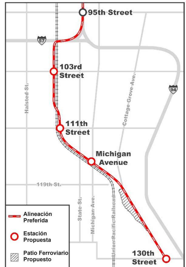
Alineación Preferida de la Extensión de la Línea Roja

Una conexión a la red de CTA es esencial: el 72% de los pasajeros quienes abordan en la estación de la Línea Roja de la 95 están viajando al norte o al sur del Loop o están transfiriéndose a otras líneas de CTA para llegar a destinos por toda la ciudad.