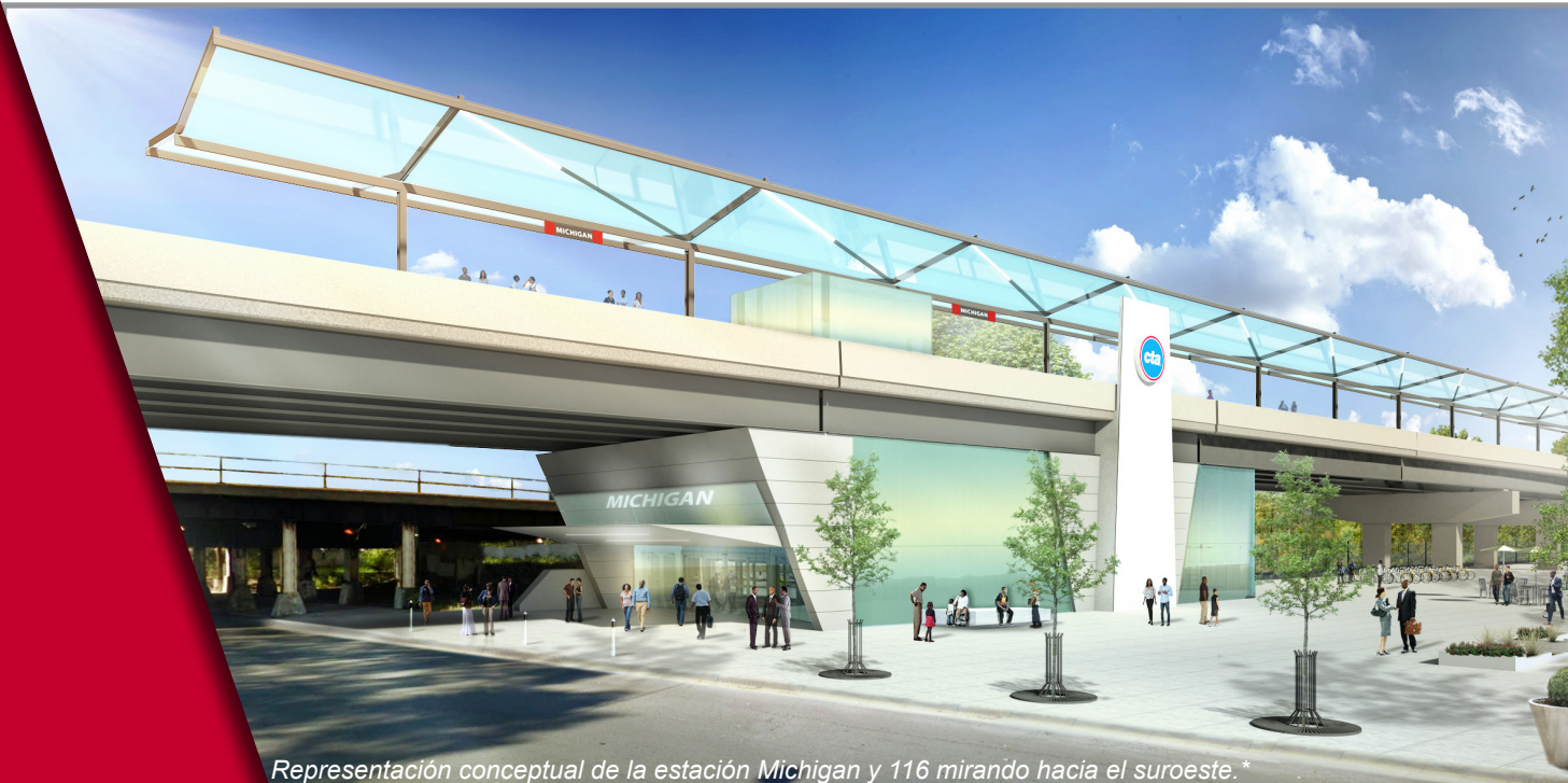
Representación conceptual de la estación Michigan y 116 mirando hacia el suroeste.*