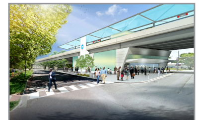
Representación conceptual de la estación de la calle 103 mirando hacia el noreste.*

*La apariencia de los elementos de proyecto en las representaciones conceptuales es intencionado para mostrar la escala de los elementos del proyecto. La apariencia actual de la construcción puede variar dependiendo en las decisiones de diseño sobre los colores, texturas, acabados y elección de características específicas del diseño.