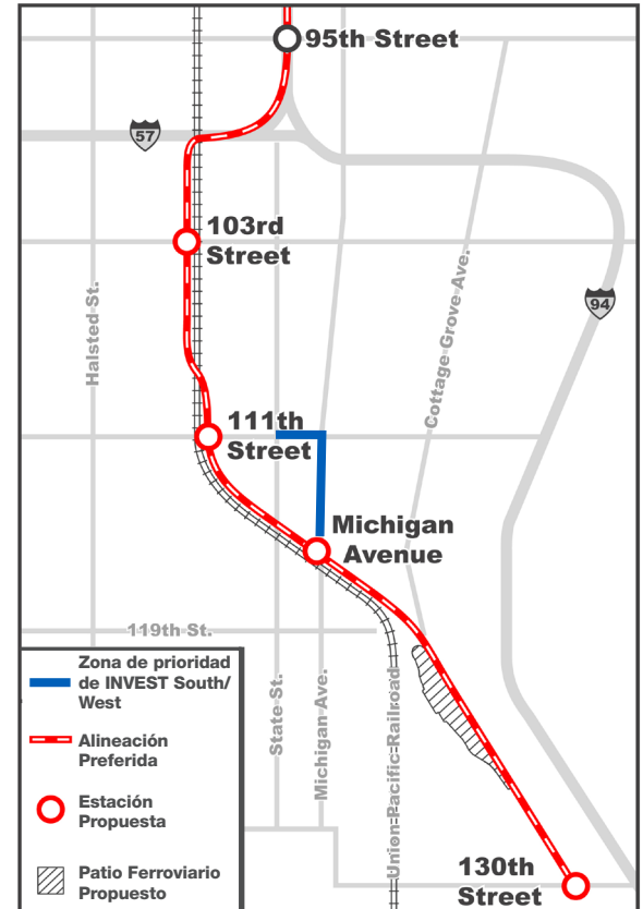
Mapa de alineación preferida

Chicago Transit Authority Strategic Planning & Policy, 10th Floor Attn: Red Line Extension Project 567 W. Lake Street Chicago, IL 60661-1465