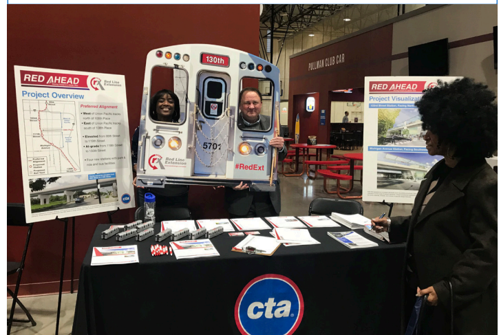
El equipo de CTA destacó la Expansión de la Línea Roja en el lanzamiento de INVEST South/West Roseland, Pullman, y West Pullman a principios de este año (foto de arriba).

"Haciendo esta inversión y proporcionando el acceso no solo revitalizará a las comunidades, sino que también será transformativo de una manera que permite a estas comunidades crecer y prosperar"